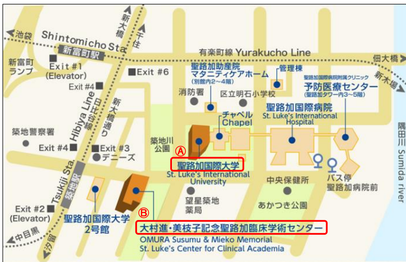
聖路加国際大学キャンパスマップ